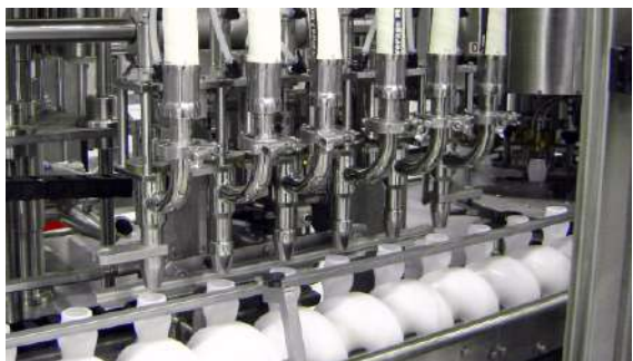
. Dosificador servoactuado . Servodriven Filler