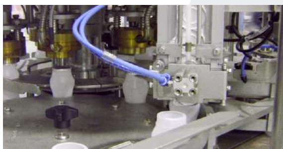
. Tapa de aluminio y termosellado . Aluminium lids and heatsealer

. Adicionales para otros formatos . Change for other sizes