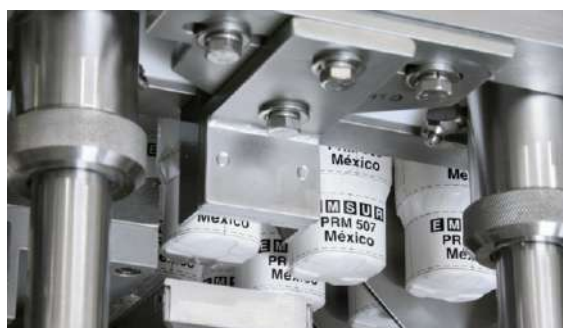
. Área de formado y decorado . Thermoforming and decoration area

In the evolution of the packaging, Bisignano has developed an exclusive cup. It is the combination of two sizes of decor that gives strength to cup's walls. A novel visual impact is achieved.