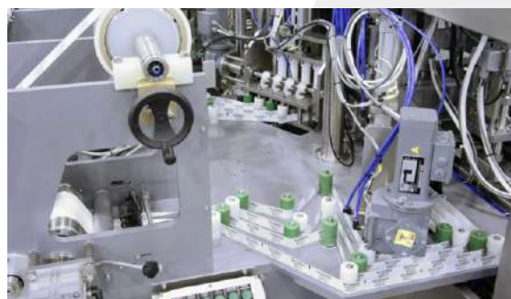
. Cabezal guía doble decor . Double decor guiding head